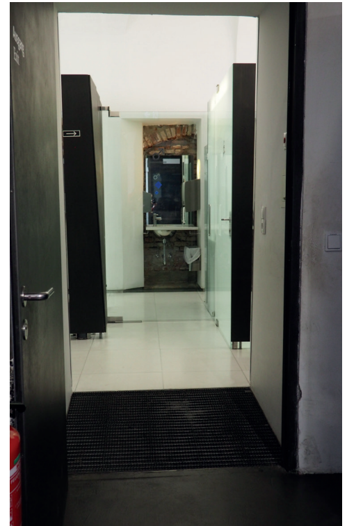
Zugang zu den WC's, 6 % Steigung